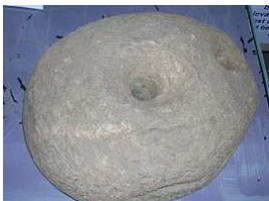
Loper van Dalgarnen Molen. The Ayrshire Museum of Country Life & Costume. North Ayrshire, Schotland.

IJzertijd : in onze gewesten wordt de ijzertijd gedateerd van 800 v. Chr. tot de Romeinen. De naam ijzertijd duidt op het veelvuldig gebruik van ijzer bij het vervaardigen van metalen voorwerpen. De periode voor de ijzertijd noemen we de bronstijd.