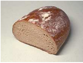
Brood gemaakt met zuurdesem.

In het Frans praat men over Levain, in het Engels over Sourdough en in het Italiaans over Madre. De Duitsers praten over een Sauerteig.