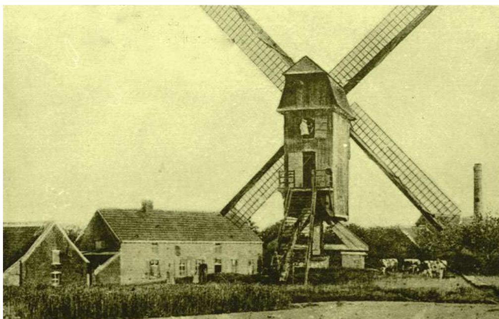
Eikouter molen - Borchtlombeek