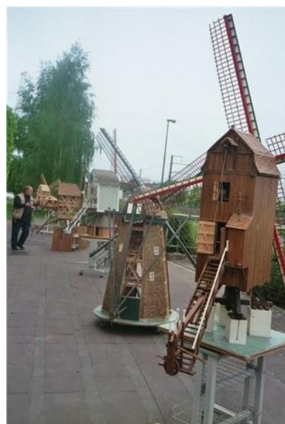
Rechts: Enkele realisaties.